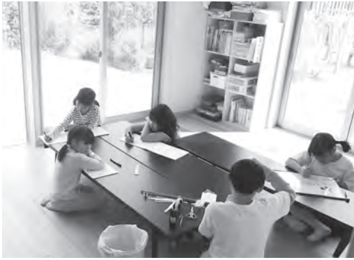
明るく、落ち着いたスペースの通称「木の部屋」

新潟市西区のNPO法人「学童保育にしっ子」から「ありがとうメッセージ」が届きました。ご紹介します。 「学童保育にしっ子」は「にいがた・新テーマ型募金助成事業」を活用して昨年、施設の新設や改修を実施。子どもたちが遊べるスペースを拡張し、騒音に過敏な子どもに配慮したスペース