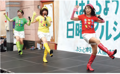
ステージいっぱい踊り続けた「P!P MON ☆」＝本町マルシェ

結成のきっかけは、東京が拠点のアラフォーアイドルグループが2011年、新潟市で開催したオーディション。アイドル活動に興味のあった3人はそれぞれを受けて合格し、ステージ活動を始めた。