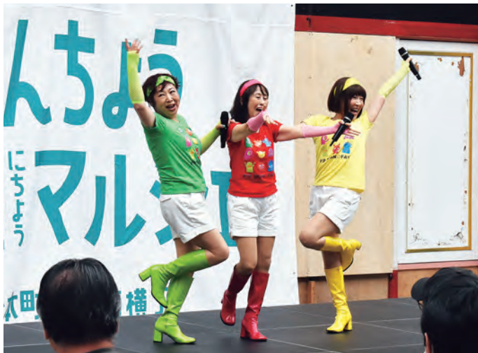
「本町マルシェ」特設ステージで歌い、決めポーズの「P!P MON ☆」。左からMoちゃん、Kちゃん、Pちゃん=5月28日、新潟市中央区