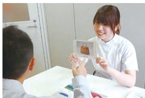
言語訓練の様子

「脳卒中で失語症になるなど、病気でコミュニケーションに問題が生じる場合があります。そういう人たちの問題の本質や発現メカニズムを見つけ出すため評