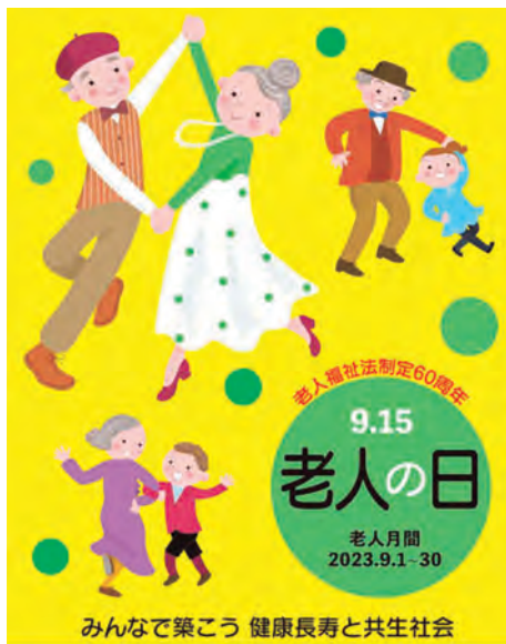
みんなで築こう 健康長寿と共生社会

「健康長寿と共生社会」の実現へ向け、キャンペーン期間中「保健・福祉のまちづくりへ、ふれあいの輪を広げる」「高齢者の社会参加・ボランティア活動の促進」「高齢者の健康づくり・介護予防の取り組み」「高齢者の人権の尊重」などの取り組みが奨励されます。