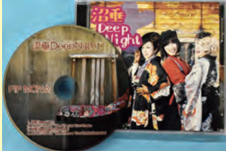
オリジナル曲「沼垂 Deep Night」のCD (1枚税込み 1000円)

CD購入や出演依頼など 「PIP MON ☆」の連絡先。 E-Mail: pipmonstar@gmail.com