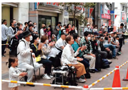
熟年アイドルのパワフルなステージに、手拍子で応える客席=本町マルシェ