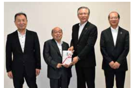
第四北越FGから県社協へ寄付金贈呈の後の記念撮影