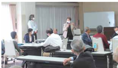
「実践者から学ぶ地域福祉と協働」＝5月15日、長岡会場