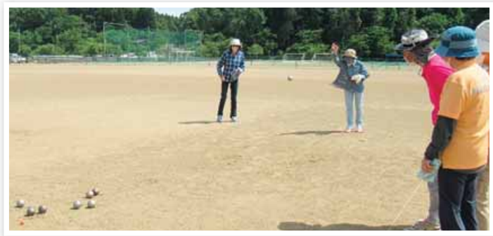
▲バタンク= 6月4日、柏崎市