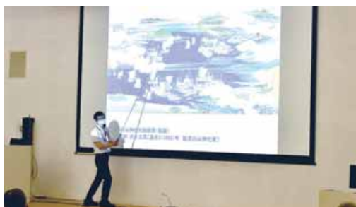
「新潟県の歴史～江戸時代の新潟町」＝6月27日、新潟会場

化が期待されます。休み時 間や講座修了後など、さま ざまな方法で生涯の仲間づ くりが可能で、会場や年次 によっては早くも連絡交換 の様子も見られます。