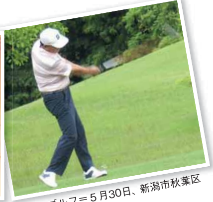
▲ゴルフ= 5月30日、新潟市秋葉区