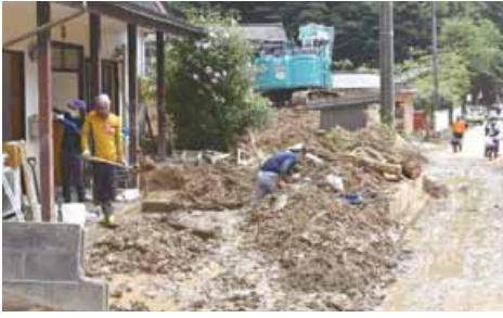
押し寄せた泥との格闘が炎天下で続いた、水害後の被災地=2022年8月12日、関川村湯沢