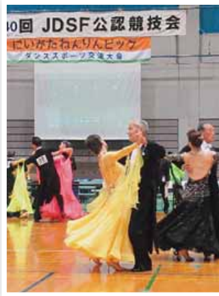
▲ダンススポーツ = 5月14日、新潟市 中央区