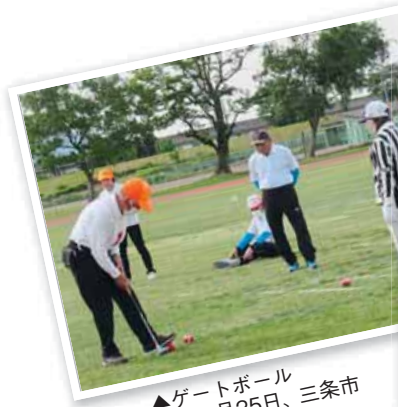
▲ゲートボール = 5月25日、三条市