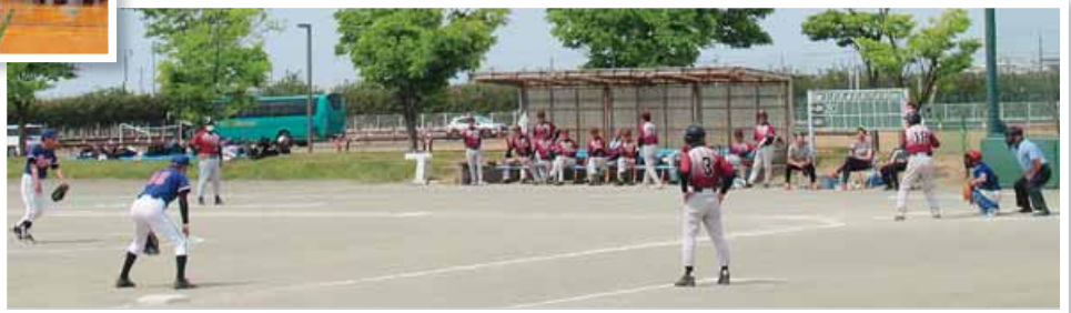
ソフトボール▶ = 5月13日、燕市