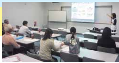
出張講座は、ミニ講義「なぜ運動が大切か」+実技のセットで、60分から90分が目安です。

センターでは、運動指導の講師派遣もしています。職場などで、ながら運動のコツを教わる時間を設けてはいかがでしょうか。仲間がいると運動への意識が高まり、継続しやすいだけでなく、食事や睡眠、ストレスなど、生活習慣全般に関心が向くようになります。