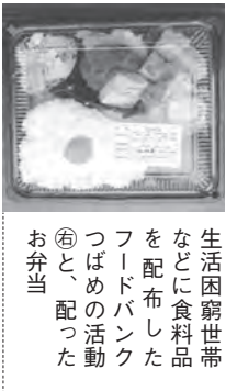
生活困窮世帯などに食料品を配布したフードバンクつばめの活動（左）と、配ったお弁当

今冬にかけ、ひとり親世帯や生活困窮世帯、合わせて延べ500人にお弁当や食料品、生活用品などを配りました。特に今回は、助成金で生鮮食品