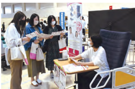
4年ぶりに開催された「新潟福祉機器展」

示会は、会場の改修による休館の後、新型コロナウイルス感染拡大などによる中止が続ぎ、今年は4年ぶりの開催となりました。