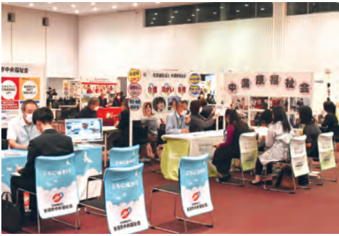
朱鷺メッセで開かれた令和5年度「福祉のしごと就職フェア in 新潟」