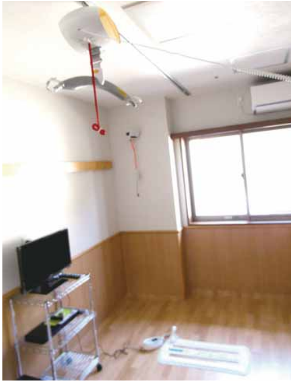
天井走行リフトと見守りシステムが配備された個室。床に置かれた白いセンサーはマットの下に敷いて使う

それを使うのは人。システムを過信せず、利用者へのリスペクトを大事にしながら活用していきたい」と力を込めました。