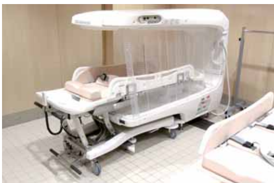
浴室にはさまざまな形態の浴槽が用意されている。写真のミスト浴は入浴する人が水圧を受けずに済む利点がある