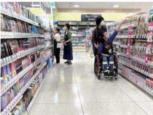
ボランティアの付き添いの下、商品陳列を手伝う子どもたち＝昨年9月、新潟市のイオン新潟東店

チャレンジワーク新潟の活動は小学生から高校生までが対象で、月に数回、1回1時間程度、一つの職場で6カ月間継続して仕事を体験します。子どもたちにはボランティアのサポートが付き添って様子を見ながら、その子に合った形で活動を進めていきます。月1回関係者が顔をそろえる報告会も貴重な交流の場になっています。