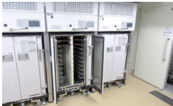
冷凍食材を使って配膳するシステム。新しい時代の食事提供手段として注目されている