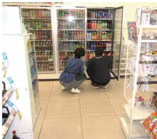
初めての職場で元気いっぱい仕事を手 伝うAさん（右） 今年4月、新潟市のファミ リーマート新潟関新店

この日はAさんがチャレ ンジワーク新潟で仕事体験 を行う初日の顔合わせで す。店のロゴが入ったジャ ンパーを着たAさんは、店 員の説明を受けた後、商品 の飲み物を並べる仕事に挑 戦しました。隣には安心で きるサポーターが付き添い ます。