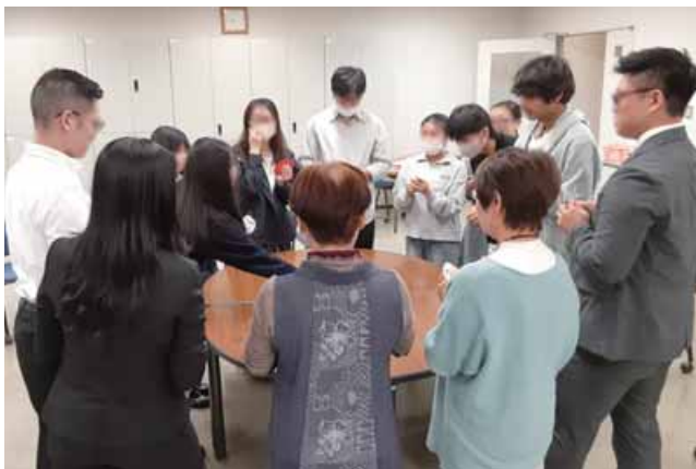
初めて開かれた異文化交流カフェの様子（2025年5月）