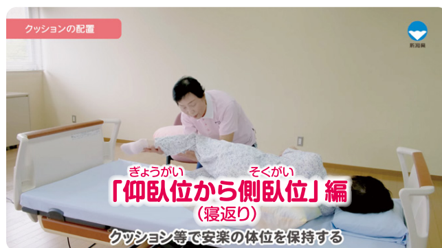
在宅介護に必要な基本介護技術「仰臥位から側臥位」編