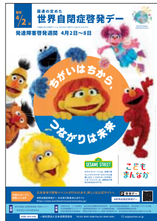
世界自閉症啓発デーのポスター

「自閉症啓発デー」「発達障害啓発週間」に関する問い合わせは、新潟県福祉保健部障害福祉課、025(280)5228へ。