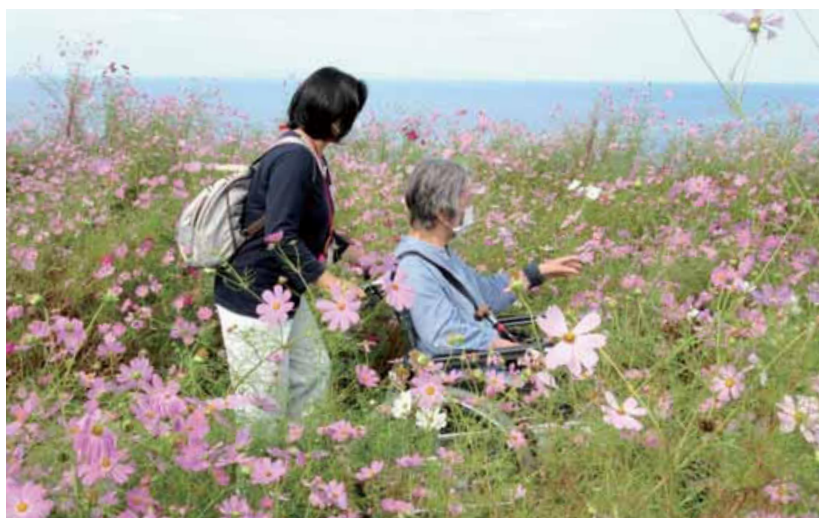
車いすでコスモス畑の散策を楽しむ利用者(2022年9月、柏崎市笠島)