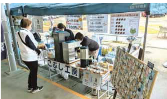
さまざまな商品が並んだ昨年のナイスハートバザールの様子（6月・長岡市）