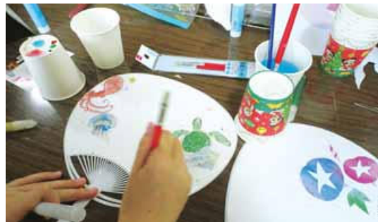
オリジナルのうちわ作りに挑戦する子ども。元気な姿に支援員も力をもらっているという

く、子どもたちの心に寄り添う活動を心がけたい。そして、子どもたちが安心して楽しく過ごせる居場所にするために、自分のレベルアップを図りたいと思います。