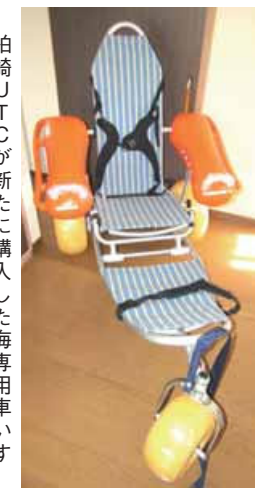
柏崎UTCが新たに購入した海専用車いす「ビーチスター」

場合によっては柏崎を離れ、県内各地や東京まで同行してサポートすることも。「私たちはあくまでもサポート部隊。利用する人が力を借りたい時には貸す。自分でできることは