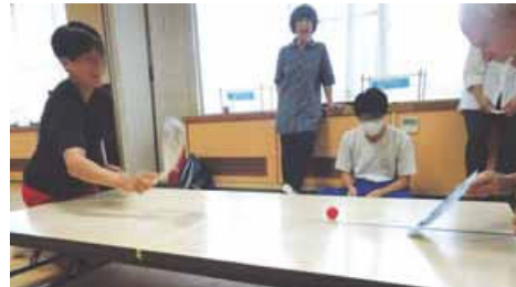
「ピンボン玉選手権」に興じる子どもたち。時々企画されるイベントは楽しいひととき

た市社協が始めました。小学生から20歳までが対象で、現在は約20人が利用しています。中学生を中心に、小学生や高校生もいます。教室は週1回、2時間程度。定期的に決まった場所で開催する日型に開く訪問型があります。講師を務める支援員は25人。大半が60代から70代で、学校の先生を退職した人が主体ですが、民間企業を退職した人もいます。支援員