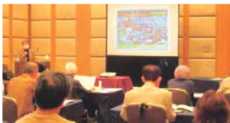
お互いさまの地域づくりと社会参加