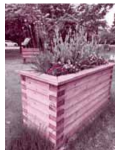
聖籠緑地の立ち上がり花壇

地域コミュニティの緑化活動などに参加すると、ご近所づきあいや多世代交流が生まれ、自然な会話のきっかけにもなります。学校の花壇づくり、公園の草刈りなどがあれば、足を運んでみてください。最近は、腰をかかめずに作業できる立ち上がり花壇も増えてきました。花がきれいに咲いている地域は、人の目が行き届いているサインになり、防犯意識の向上にもつながります。