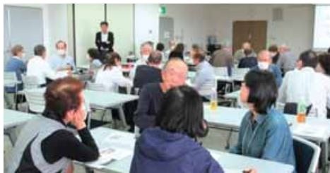
自然災害と自助力・共助力