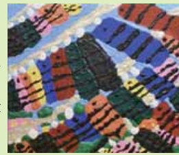
コイのぼり（令和7年5月号）