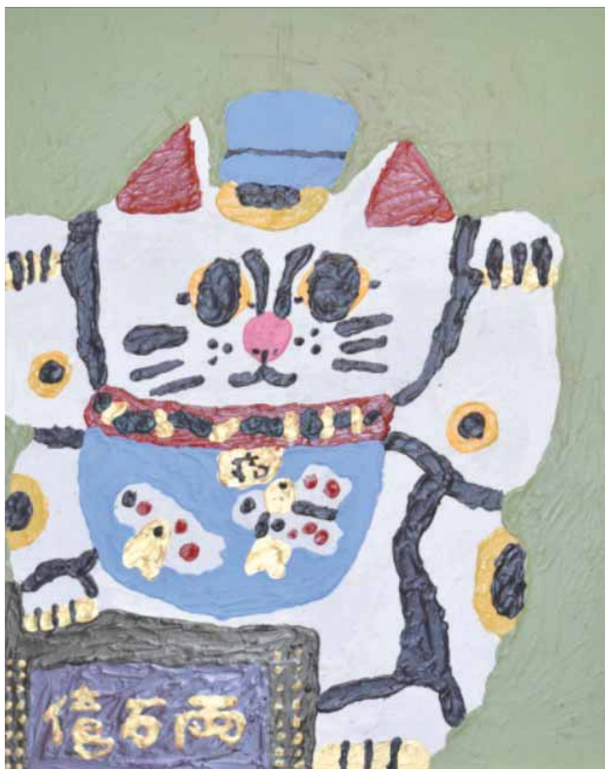
絵 「招き猫」 作・新井 里沙(加茂市) 〈作者一言〉商店主らに人気のある縁起物の招き猫。読者の皆様にも招福を