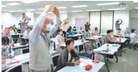
賢い消費者～悪質商法の被害にあわないために～