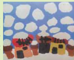
雪景色の町（令和8年1月号）

2020年に栃木県で開かれた障がい者アート全国公募展で優秀賞。21年には、東京のモスバーガー原宿表参道店の店舗装飾に作品が採用されました。地元柏崎でも展覧会に出展したりライブペイントに挑戦したり、幅広く活動しています。その作品は、柏崎市内を走るAI新交通「あいくる」のラッピングやJR新潟駅工事現場の装飾にも採用され、社会的に高い評価を得ています。