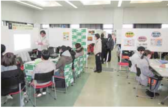
福祉業界への就職を目指す人と施設が直接面談した「福祉のしごと就職フェア」2月7日・新潟ユニゾンプラザ

福祉・介護業界への就職を目指す人と、県内福祉施設の担当者が直接面談できる「福祉のしごと就職フェア in 新潟」が2月7日、新潟市中央区の新潟ユニゾンプラザで開かれ、50人を超える参加者がブースを回りながら進路を探りました。