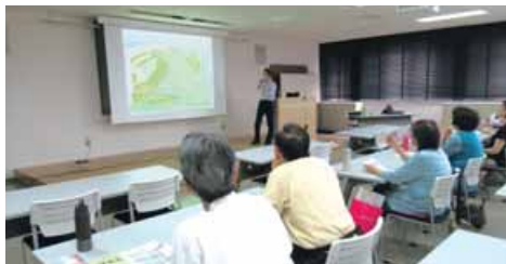
新潟県の歴史～みなとまち新潟のあゆみ～