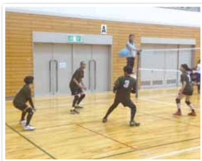
▲ソフトバレーボール