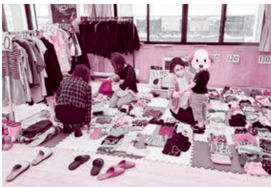
村上 ohana ネットが行った子ども服などのリユース活動

また、生理用品の配布を知った市内の小・中学校からも問い合わせがあり、毎回生理用品を受け取りに来る子どもに対して