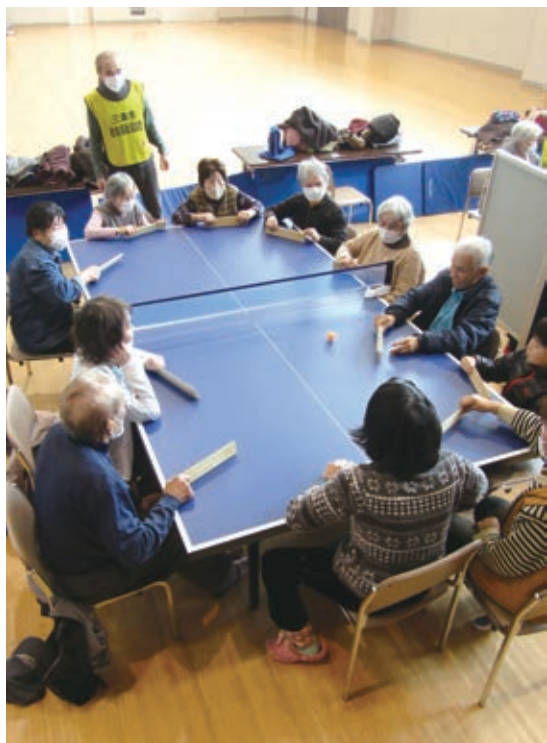
卓球バレー体験会で競技する参加者たち。障がいの有無や世代を超えて和気あいあいとした時間を過ごした11月6日、三条市総合福祉センター