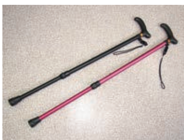
アルミ合金製の伸縮式。色見もおしゃれな、その名も「超軽量疲れな杖」

した。「リハビリ用の靴には使いにくいものがあり、『なんでこんなものを』と疑問に感じた。