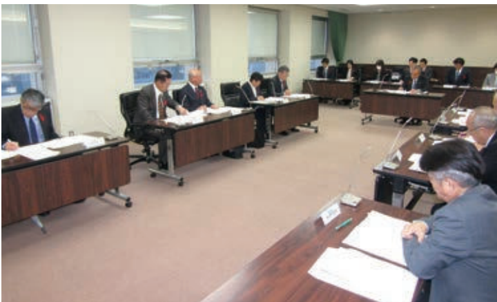
④県内11団体による花角知事への新年度予算要望