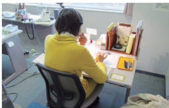
電話相談を受ける相談員。顔の见えない相手に寄り添おうと心を砕く

以前電話した人がまたかけてくることもあり「あるとき話を聞いてもらって本当に助かりました、という声に支えられている」という相談員もいるそうです。顔も身元も分からない者同士。相談員たちは今日も受話器を通して、つらい思いを抱えた人たちに寄り添い、心を通わせようと静かに奮闘しています。