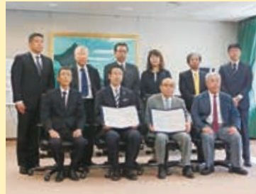
協定式(平成29年9月12日)

また、協定に基づき、平成30年3月には、新潟県地域防災計画の「要配慮者の安全確保計画」に災害福祉支援チームの活動が位置づけられています。