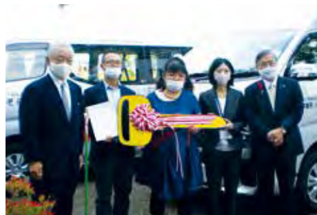
障害者支援の2施設へ車両が贈られた