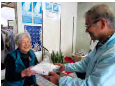
歳末たすけあいで「おせち」を1人暮らし高齢者へお届け＝令和元年、新潟市