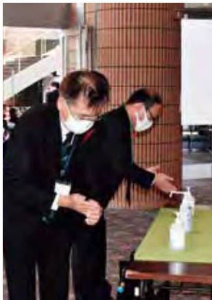
▲入り口でまずは手指のアルコール消毒