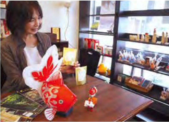
新発田の夏祭りで子どもが引く山車「金魚台輪」の張り子や土鈴、新発田産のレンギョウのお茶もある。逸話は尽きない

季節のしつらいが行き届き、職人が手がけた調度品がさりげなく普段使われている。当たり前前に感じていたのですが、どこにもでもあるものではない。この街の魅力だと気づかされました。城下町なので今も職人の文化が息づいています。事務所の近所に日本刀を磨く刀研師が現役で活躍されているんですよ。この方は代々続く刀職人の3代目です。誇りを持つてものづくりをする人たちの姿は印象深く、格好いい息を呑む熟練の技を間近に見られる街なんです。