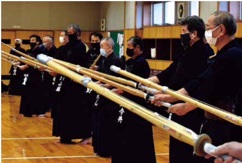
キリリと竹刀を構える県高齢剣友会のシニア剣士たち

新型コロナウイルスの感染拡大により1年延期された第33回「全国健康福祉祭ぎふ大会」（愛称・ねんりんピック岐阜）。2021年10月30日の開催へ向け準備が進められており、大会出場を目指すシニアスポーツマンたちも練習に汗を流しています。深まる秋の週末、燕市で行われた新潟県高齢剣友会の稽古取材する一方、来年の岐阜大会の競技会場マップを眺めてみました。