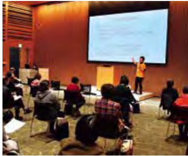
「正しく理解」を目指した認知症サポーター養成講座Ⅱ新潟日報メディアシップ

地域共生社会を探るイベント「知る・学ぶ」福祉・介護・健康「in新潟」が11月8～14日、新潟市中央区で開催されました。毎秋恒例の「フェア」を小規模化。月内に上越市（14日）と長岡市（21～29日）でも開催。県社会福祉協議会と新潟日報社、さらに開催地の3市社協が主催しました。 新潟市では8日、新潟ユニゾンプラザで、元