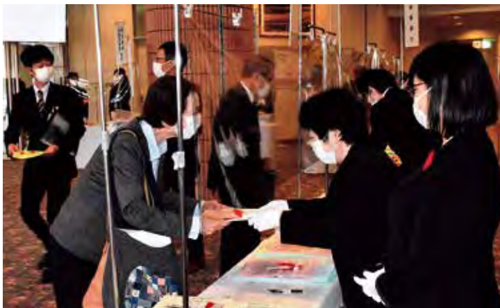
▲飛沫防止シートを設けた受け付け。感染を警戒し、スタッフは緊張しながらも参加者を温かく出迎えた