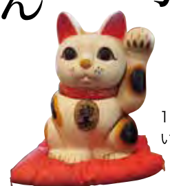
1階にいる招き猫。いい出会いは私のおかげだニヤ～