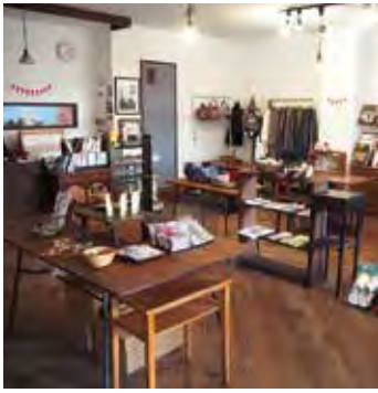
街角こんばす事務所1階のギャラリー・ショップ。誌面で紹介した手仕事品などを展示販売