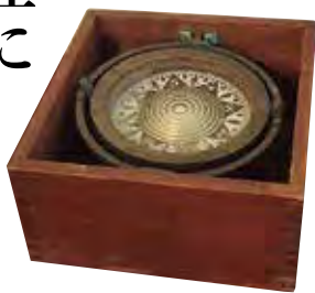
▲受賞のお祝いにと友人からプレゼントされたコンパスの骨董品