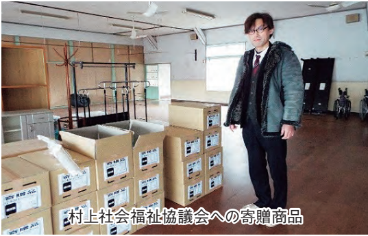
村上社会福祉協議会への寄贈商品