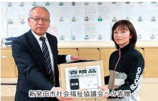
新発田市社会福祉協議会への寄贈

さらに、3月26日には新型コロナウイルス感染症対策に伴い、各学校における休校措置などの理由により学童保育施設や児童養護施設、家庭で長時間過ごす児童が増え、おやつなどの需要が高まっていることから、①菓子類②セブンプレミアム素材の味を生かした