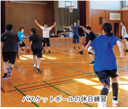
バスケットボールの休日練習

県立江南高等特別支援学校の保護者の強い思いを出発点とするNPO法人「新潟ユニバーサルスポーツ・文化推進協会」。一昨年には、活動・交流・情報発信の拠点としての地域活動支援センター「IUP」(ワンナップ)を設け、アートとバスケットボール、フロアホッケーの3本柱のクラブ活動を活発化するとともに、障がいのある人への理