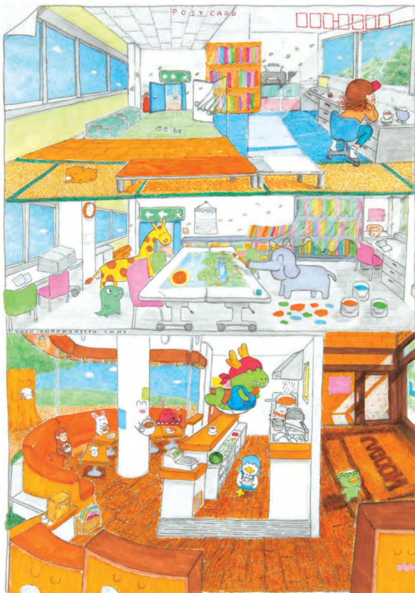
絵 しゅんすけ「たのしい日々はたからものになるよ」(えかき・新潟市西区)