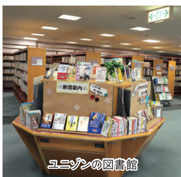
ユニゾンの図書館

なお、新型コロナウイルス感染拡大防止のため、パレットは5月10日（日）まで、図書館は5月11日（月）まで休みます（予定）。