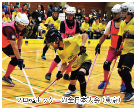
フロアホッケーの全日本大会(東京)