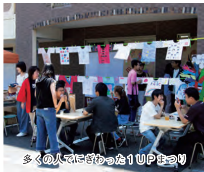
多くの人でにぎわったIUPまつり

います。毎年全員が、アクリル絵の具でキャンバス作品を制作することを目標としています。互いの作品を鑑賞するなどの仲間意識づくりにも気を配っています。ここでも楽しそうな笑い声と笑顔がいっぱいです。夏には恒例の3クラブ合同の1泊2日の合宿があります。