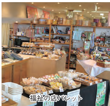
福祉の店パレット

パンは日替わりで各施設自慢のものが届きます。地産地消のジャムやコンポート、農福連携の大豆粉ドーナツなど評判は上々。ファッション雑貨や1点1点表情が違う手作りの布製人形、ベビースタイなどを