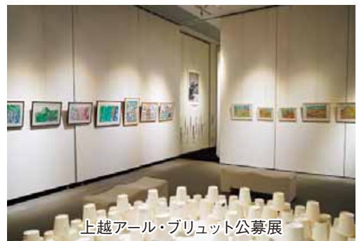
上越オール・ブリュット公募展

昨年、第34回国民文化祭にいがた大会の事業として行った「上越オール・ブリュット公募展」ものど語りには100人(健常者も含む)もの応募がありました。県内で多くの障害のある作家が日々、創作活動に励んでいることを示しています。