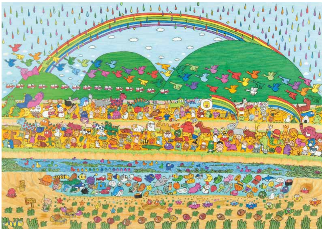
絵 しゅんすけ「みたらせ湯2020」(えかき・新潟市西区)