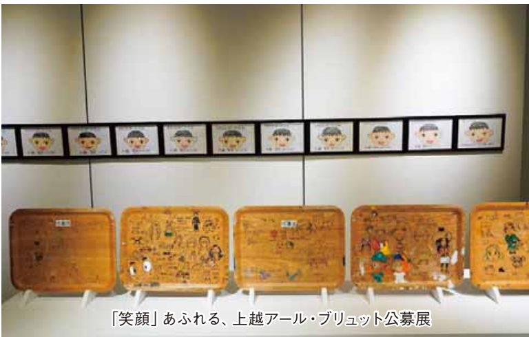
「笑顔」あふれる、上越オール・ブリュット公募展

点と点を結び面とする作業は進み、作家の情報整理や繋がりができてきたと言います。また、いろいろな形での展覧会開催は、障害のある本人だけでなく家族を含めて会場に来る機会を増やし、他の作家との出会いや交流が生まれるという効果も出ているそうです。