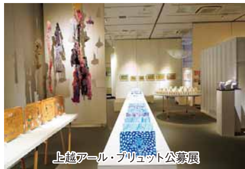
上越オール・ブリュット公募展

点と点を結び面とする作業は進み、作家の情報整理や繋がりができてきたと言います。また、いろいろな形での展覧会開催は、障害のある本人だけでなく家族を含めて会場に来る機会を増やし、他の作家との出会いや交流が生まれるという効果も出ているそうです。