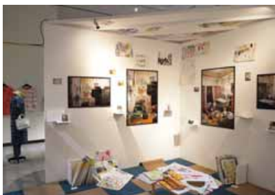
昨年実施した上越アール・ブリュット公募展 (上越市)

いたことが縁で、2017年に転職しました。法人にはNASCのほか、高齢・障害・児童・総合相談・生活困窮者支援と多岐にわたる事業があります。アートの支援の他、法人内のリクルート・新卒者研修も担当しています。 「すっかり10代20代の福祉職を育てていく仕組みをつくりたい。そのために我々世代が、いつまでも自称若手のポジションに甘んじるじゃなく、ちゃんと人を育てる役割があることを自覚しないといけない」とのこと。年間スケジュールで新卒採用研修の日程を最優先に入れていま