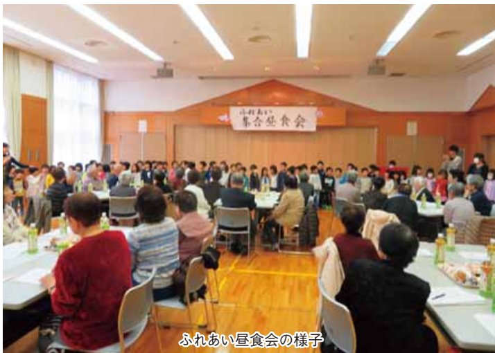
ふれあい昼食会の様子

田上町社会福祉協議会では、赤い羽根共同募金の助成を活用して、65歳以上の一人暮らしの高齢者を招待する『ふれあい集合昼食会』を年1回開催しています。これは、様々な世代の交流を目的としています。