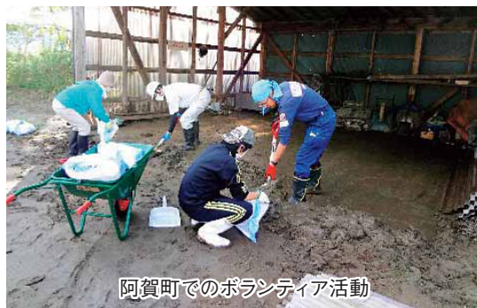
阿賀町でのボランティア活動

阿賀町では、被害が発生した10月13日から阿賀町と阿賀町社協が連携し、浸水被害世帯の訪問調査とニーズ把握を行い、ボランティア活動の必要性を確認しました。被害状況等から、災害VCを設置し、広くボランティアを呼びかける形を取らず、町民ボランティア