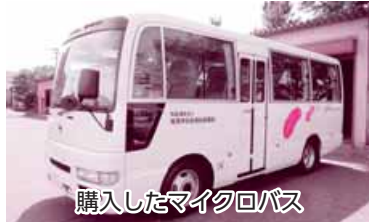
購入したマイクロバス

このマイクロバスは、社協での色々な事業や県民福祉大会等の送迎、事務受託団体である老人クラブ連合主催の各種事業の送迎など様々な地域福祉活動で使用しており、これまで以上に活用していきたいと思えます。