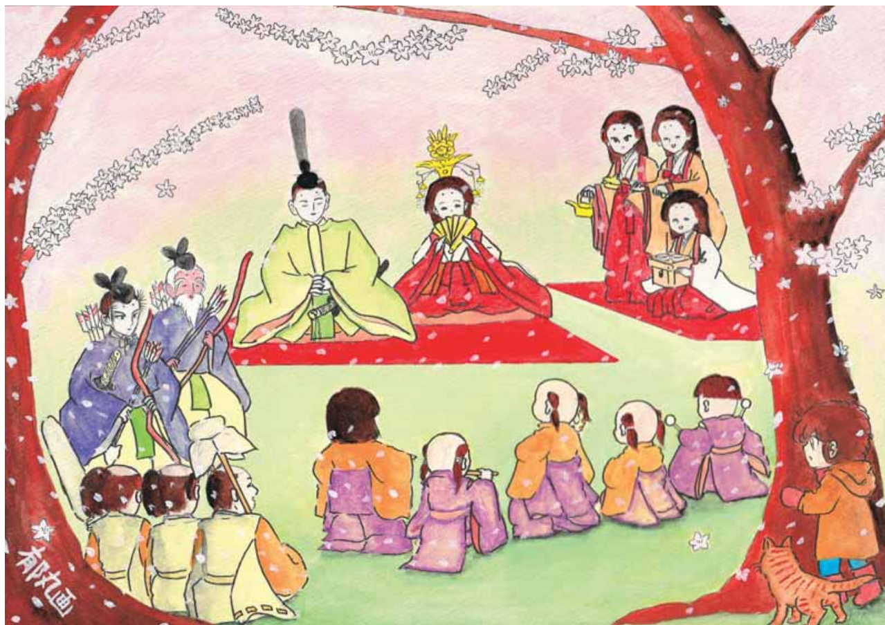
絵 高橋 郁丸「ひな祭り」(漫画家・新潟市中央区)・文 11面