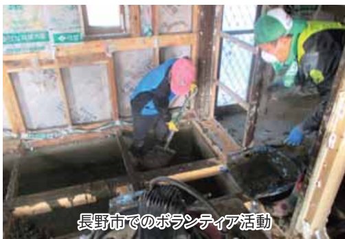
長野市でのボランティア活動

けた地域を長期にわたり支援していくには、この度の長野市北部災害VCのように、県社協と地元社協が中心となり、行政、企業、NPO、学校等多様な機関が連携していくことが大切です。そのためにも、地元のさまざまな団体と関係性をつくることやスタッフの育成等、日頃からの備えの必要性を改めて認識しました。