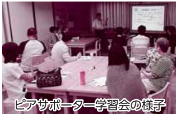
ピアサポーター学習会の様子