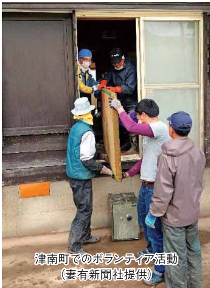
津南町でのボランティア活動

台風19号がもたらした記録的大雨により、信濃川、阿賀野川流域が氾濫し、床上・床下浸水被害が県内各地で発生しました。新潟県社協は、10月13日から市町村社協に対して、被害状況や災害ボランティア活動の必要性について確認を行いました。10月15日には阿賀