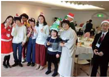
楽しいクリスマスパーティー

「前向きに笑顔を絶やさず頑張っているこう」法人名に込められた思いを体現しています。