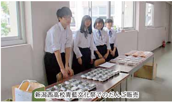
新潟西高校青藍文化祭でのだんご販売

新潟西高校ボランティア部は創部15年。毎週木曜日の放課後、やりたい活動を話し合い、土日や夏休みなどに、さまざまなボランティア