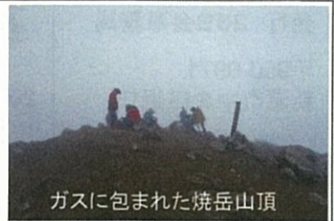
ガスに包まれた焼岳山頂

【蔵王】9月26・27日 温泉旅行も兼ねて蔵王に登った。健脚組は刈田岳から熊野岳を回り、散策雲は刈田岳からお釜展望にむかった。この日は快晴でお釜の展望も素晴らしい。熊野岳山頂からの展望も最高だった。