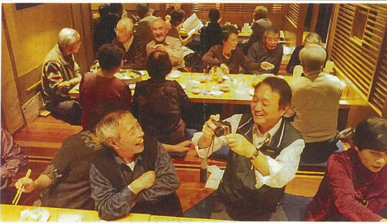
(総会の後実施された懇親会で盛り上がるメンバー)

11月25日、会員29名参加のもと27年度総会が開催されました。会場の駅前「日本海庄屋」には開催を待ちわびた参加者の多くがや28年度の活動計画が集合時間よりも早く発表されました。サークル毎の活動には、多少の差はあるものの、各サークルの熱意が伝わる説明から今後の継続性や必要性が十分に伺えました。これが高齢者の集まりかと思えない程の盛り上がりを見せた宴も時々の制約には勝てずお開きとなりました。