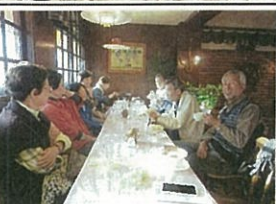
レトロな喫茶店で休憩

ゴルフ愛好者の会 27年度最後の開催は9月10日、阿賀高原ゴルフ倶楽部。山岳コースにてごすましみがたが楽しかったです。それが出来ました。